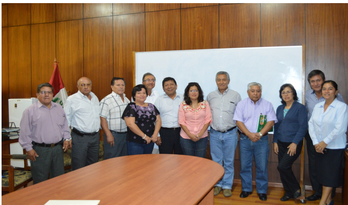
Equipo de trabajo del Vicerrectorado de Investigación - UNPRG.

¡RESPONSABILIDAD, COMPROMISO Y CUMPLIMIENTO !