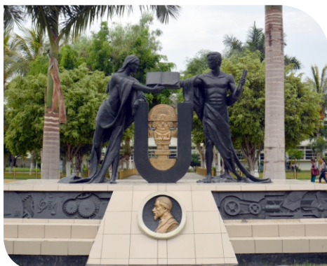
Plaza del Saber