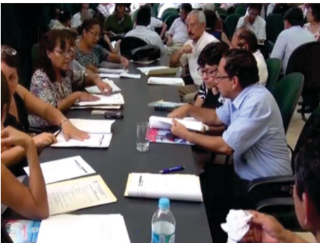
Docentes UNPRG participando del Taller